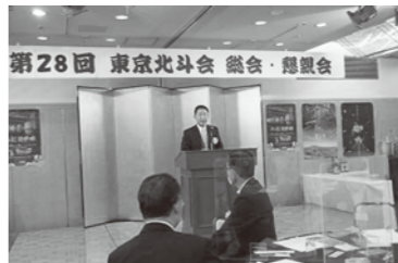
昨年の総会の様子

問 東京北斗会事務局 090・7205・6395(宮崎) 080・6570・3744(外山)